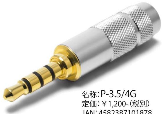
名称:P-3.5/4G 定価: ¥1,200- (税別) JAN:4582387101878