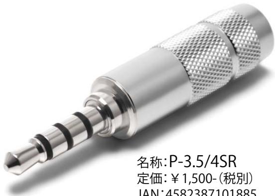
名称:P-3.5/4SR 定価: ¥1,500- (税別) JAN:4582387101885