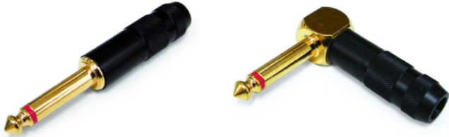
※P-275BS (L) は本体部が純金メッキとなっております