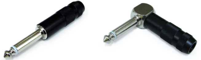
※P-275BS (L) は本体部がニッケルメッキとなっております

パフォーマンスに対する「NEO」のこだわりはどこから生まれるのでしょうか？ 既成の概念をぶち破り、自らの手で越えようとする情熱から生まれた1/4" フォーン・プラグ「Pシリーズ」。スティックなまでにシンプルさを追求し、不要な物をそぎ落とした結果、本来の機能性を発揮出来る本物のクオリティを創り出すことに成功しました。完全国内生産だから出来る精密加工によって、一本の真鍮から削り出される本体とカバー。あえて JIS 規格（日本工業規格）ではなく、米 SwitchCraft 社と同様、JEITR 規格に準拠させ、国産、輸入機器を問わず幅広く対応し、そのスタイリッシュな外観からは想像もつかない程、パワフルでクリアなサウンドを奏でます。